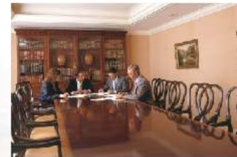
Met gemak een vergadering van 4 uur digitaal vastleggen, dat is het voordeel van Bytescribe.

Voor alle vragen en antwoorden kunt u terecht op www.digitaldictation.nl .