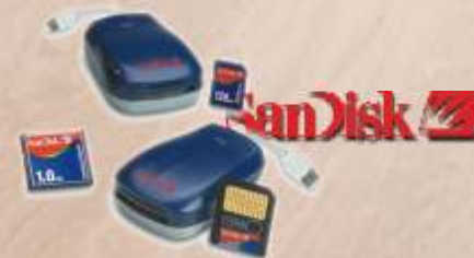
Voorbeeld van een Cardreader en een Compact Flash Card.