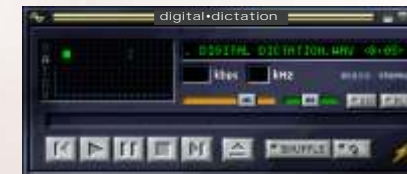
Dit is het Digital Dictation scherm op uw monitor. U kunt hier Start, Stop, Spoelen, Volume harder en zachter regelen. Tevens kunt snel "scrollen" naar een geluidsfragment.