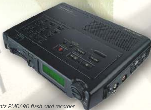
Marantz PMD690 flash card recorder