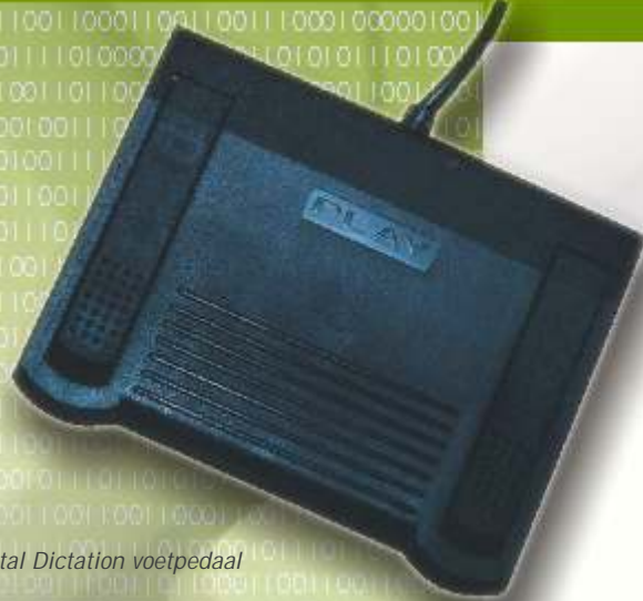
Digital Dictation voetpedaal